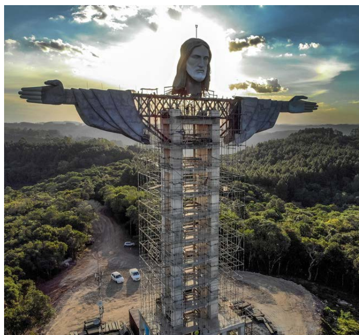
Figura Jezusa w budowie (Encantado)

43 metry wysokości (figura Chrystusa w Rio ma tylko 38 metrów). W środku figury powstanie winda, którą będzie można dostać się do punktu widokowego na wysokości ok. 40 metrów. Nie będzie to jednak najwyższa figura Chrystusa na świecie. Wyższy jest Chrystus z polskiego Świebodzina, który liczy, wraz z podstawą, 52,5 metra, podobnie jak figura Jezusa Buntu Burake na indonezyjskiej wyspie Sulawesi (Celebes). Budowę figury rozpoczęto w 2019 r. z inicjatywy lokalnego polityka Adroaldo Conzattiego, który zmarł w marcu br. po zakażeniu koronawirusem. Jak podali organizatorzy, Stowarzyszenie Przyjaciół Chrystusa, realizacja projektu ma zakończyć się przed końcem br. Budowa finansowana jest z wpłat osób indywidualnych i firm. Jak informuje portal France24, projekt ma zarówno inspirować wiarę, jak i zachęcać do turystyki w tym regionie.