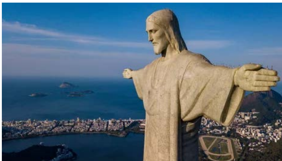
Figura Jezusa w Rio.