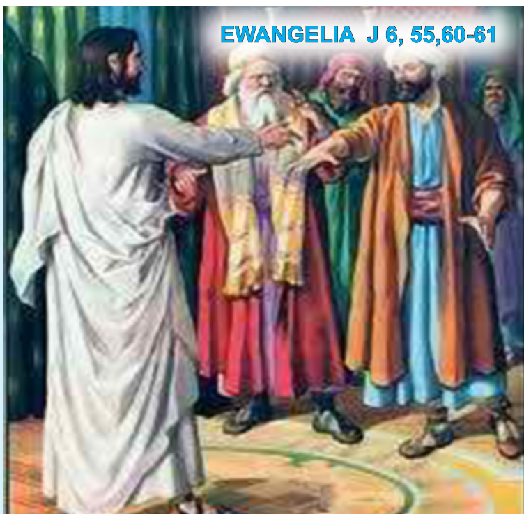
EWANGELIA J 6, 55,60-61

Od tego czasu wielu uczniów Jego odeszło i już z Nim nie chodziło. Rzekł więc Jezus do Dwunastu: „Czyż i wy chcecie odejść?” Odpowiedział Mu Szymon Piotr: „Panie, do kogo pójdziemy? Ty masz słowa życia wiecznego. A my uwierzyliśmy i poznaliśmy, że Ty jesteś Świętym Bożym”.