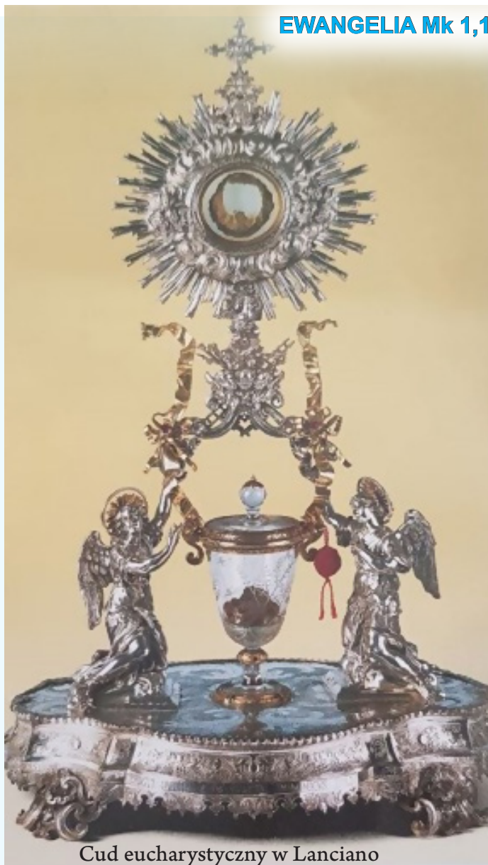
Cud eucharystyczny w Lanciano