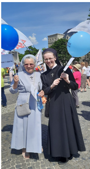
SIOSTRY NA MARSZU DLA ŻYCIA

W przyszłą niedzielę zbiórka ofiar do skarbon na KUL i Wydział Teologiczny UAM.