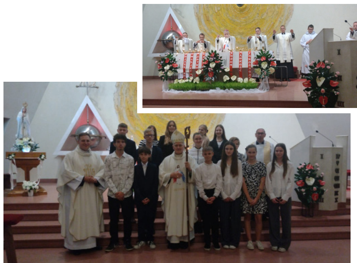
40. ROCZNICA ŚWIĘCEŃ KSIĘDZA PROBOSZCZA